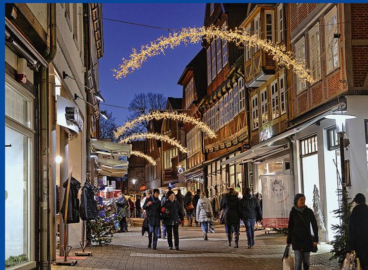
Die weihnachtliche Altstadt von Stade