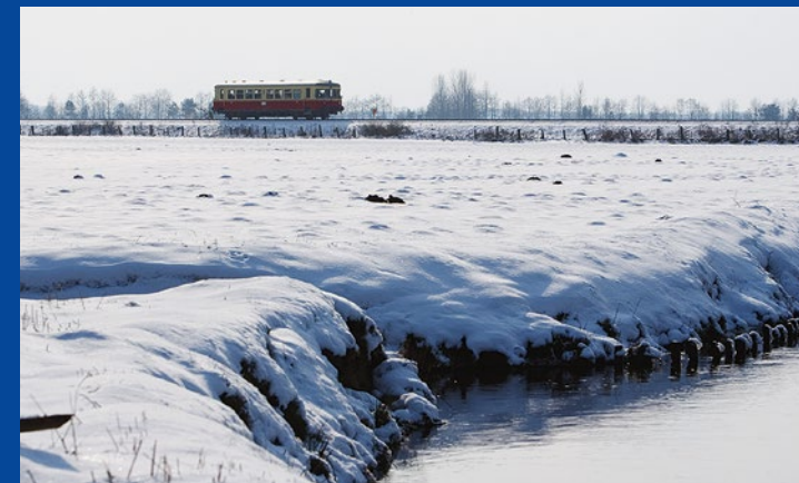
Genießen Sie Winterfreuden mit dem Moorexpress