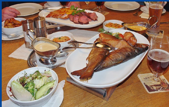
Räucherspezialitäten in Tietjens Hütte