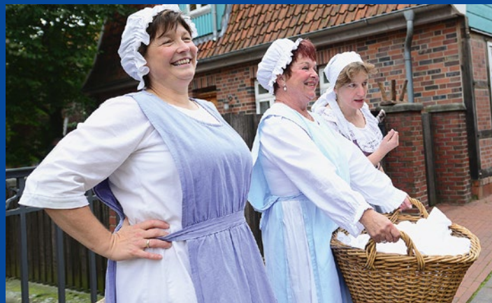
Erlebnissführung über die Welt der Hanse