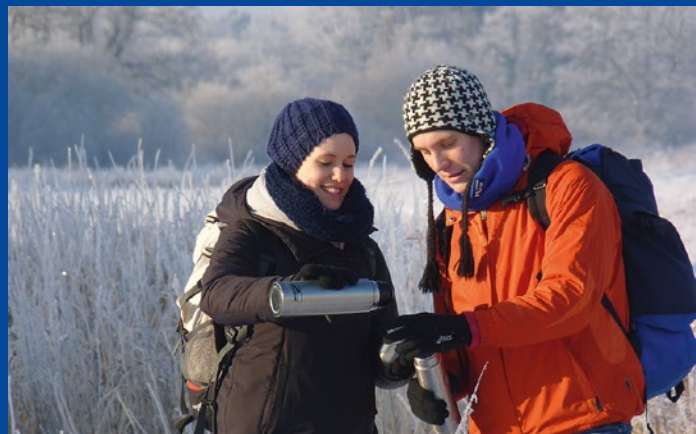
Winterwanderung auf dem Qualitätswanderweg NORDPFAD Hölzerbruch-Malse