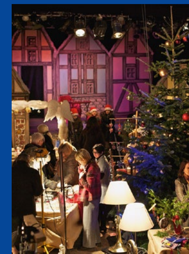
Weihnachtsmarkt in der Music Hall

Durch das winterliche Teufelsmoor bringt Sie der Moorexpress von Stade ins Künstlerdorf Worpswede. In der Music Hall präsentieren sich rund 40 Aussteller und Kunsthandwerker im Ambiente einer kleinen historischen Stadt. Rund um den großen bunt geschmückten Weihnachtsbaum im Saal, aber auch auf dem Außengelände laden die liebevoll dekorierten Stände und Holzhütten zum ausgiebigen Hören, Sehen, Schmecken, Riechen und Fühlen ein. Bei einem gemütlichen Bummel durch die „Weihnachtsstadt“ können Sie Advents- und Weihnachtsdekorationen oder ausgefallene Geschenke kaufen. Natürlich ist auch für das leibliche Wohl mit winterlichen Spezialitäten gesorgt. Am Mittag erwartet Sie in der Worpsweder Zionskirche ein kleines Orgelkonzert auf der vom Orgelbauer Dietrich Christoph Gloger 1762 errichteten Orgel, die bis 1900 ihren Dienst tat. Im Jahr 2004 entschloss sich die Kirchengemeinde zu einer Rekonstruktion der Gloger-Orgel, die von der Orgelbau-Werkstatt Ahrend aus Leer durchgeführt wurde. Im März 2012 konnte das neue Instrument mit seinem historischen Klanggewand eingeweiht werden.