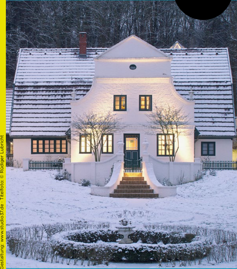
Gestaltung: www.studio37.de · Titelfoto: © Rüdiger Lubricht