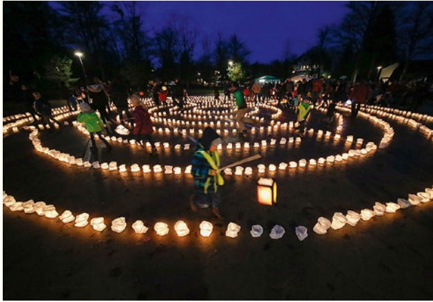
Lichterfest am 11.11.2016 in der Bergstraße