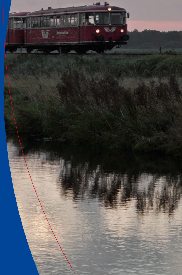
Gestaltung: studio 37, Worpswede.